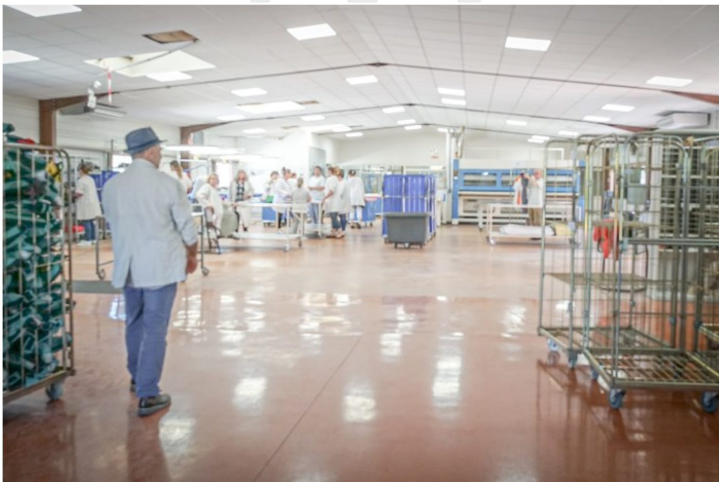
Blanchisserie rénovée de l'ESAT, Prats-Carlux.