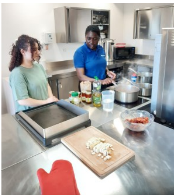
Atelier cuisine du Monde, Repas Angolais 22 juin 2022

Sur orientation d'un partenaire conventionné, les jeunes non-résidents pourront désormais accéder à l'épicerie. Ainsi, la Mission Locale du Périgord Noir, le Centre Intercommunal d'Action Sociale Sarlat Périgord Noir et l'Association Itinérance, après avoir contribué à l'élaboration du projet, participeront à la phase d'expérimentation qui durera jusque fin 2023.